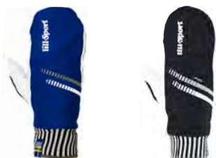
Royal Blue 0413-04