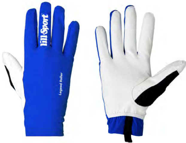
Royal Blue 0408-04