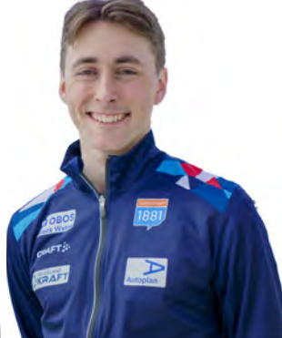
Jarl Magnus Riiber