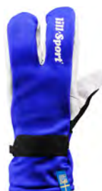
Royal Blue 0617-04