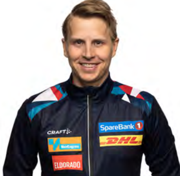
Simen Hegstad Krüger