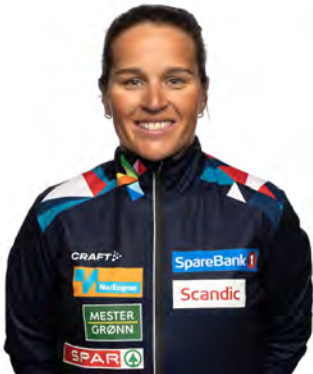
Lotta Udnes Weng