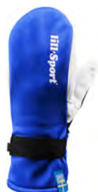
Royal Blue 0116-04